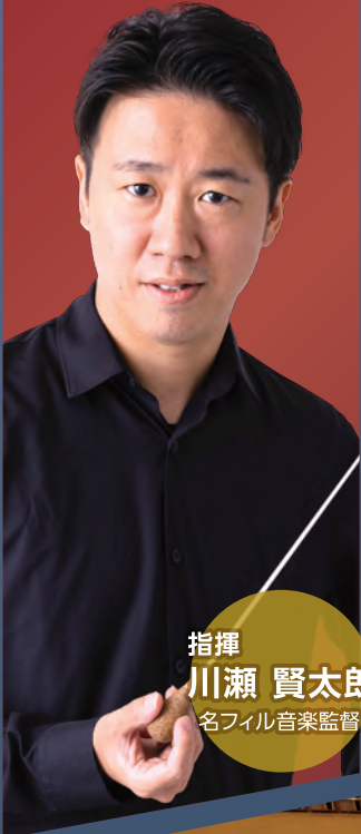
指揮 川瀬 賢太郎 名フィル音楽監督